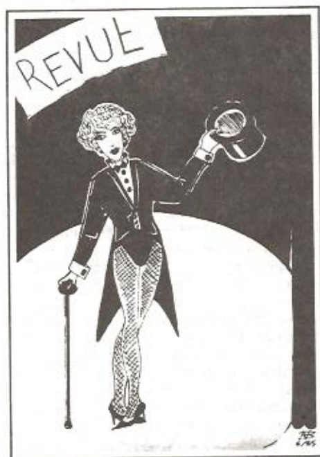
Couverture des programmes réalisés par les élèves d'OSO.

• « Der diener zweier Herren » (Les deux maîtres) de Carlo Goldoni ;