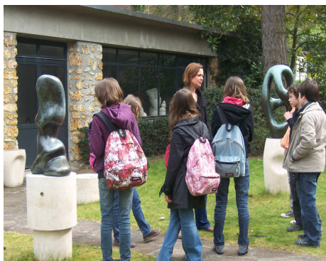
Visite à la fondation Jean Arp

Si votre appétit s'est ouvert, vous trouverez matière sur notre blog : www.baraquemeudon.canalblog.com