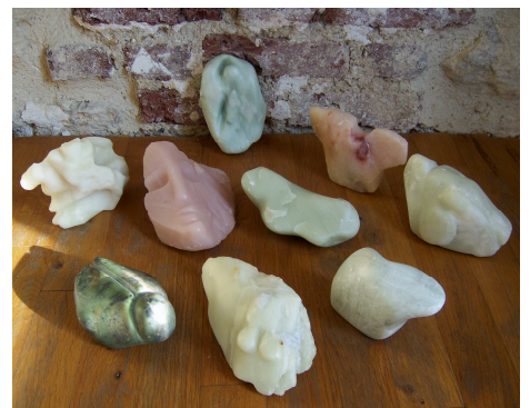
Sculptures des 5 èmes