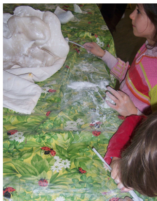
Taille de pierres des CE1